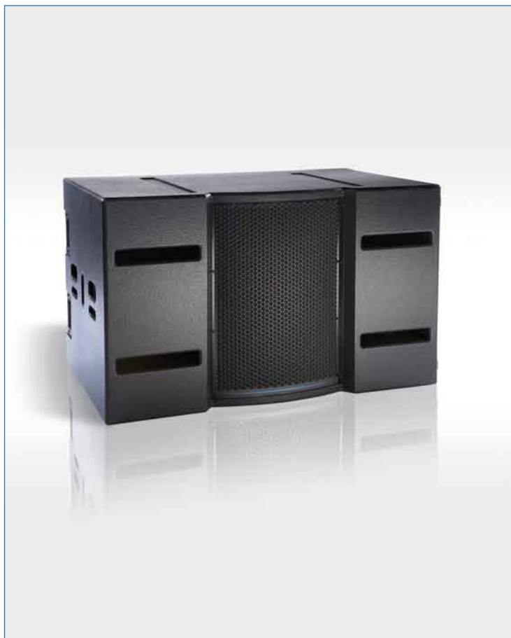
Enceinte d'infra basse TB218S

Le "subwoofer" TB218S est une enceinte de basses et d'infra basses de nouvelle génération alliant hautes performances acoustiques à une ergonomie répondant aux exigences des exploitants professionnels.